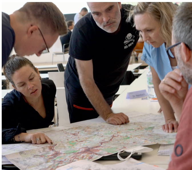
Gruppenarbeit zum Thema Raumplanung & Katastrophenvorsorge

Die Unterrichtsinhalte und -struktur entsprechen einem didaktischen Leitbild, das auf die Lehr- und Lernform des Fernstudiums zugeschnitten ist. Die Inhalte werden durch Präsenzveranstaltungen (Blockseminare) und anschließende Phasen des Selbststudiums vermittelt. Diese Form des „blended learning“ vereint die Vorteile des Seminars mit den Möglichkeiten einer individuell gestaltbaren Phase des Selbststudiums. Über die Lernplattform eCampus können die Studierenden untereinander in Kontakt treten und Formate des kollaborativen Lernens nutzen. Des Weiteren stehen interaktive Lernmodule zur Vor- und Nachbereitung der Unterrichtseinheiten digital zur Verfügung. Einige Unterrichtseinheiten werden zudem durch Online-Seminare und weitere Lehr- und Kurzvideos ergänzt. Unsere Dozierenden begleiten das Selbststudium und stehen für Fragen und Gespräche zur Verfügung.